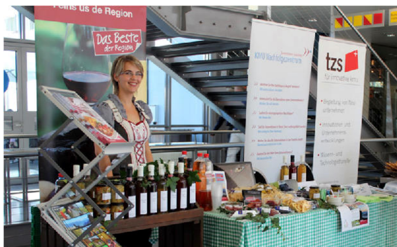
REV-Stand an der letztjährigen Tischmesse Ausserschwyz.